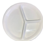
L10003 Assiette 3 compartiments