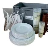
KIT 10 personnes