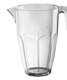
L30001 Carafe 2.25 L